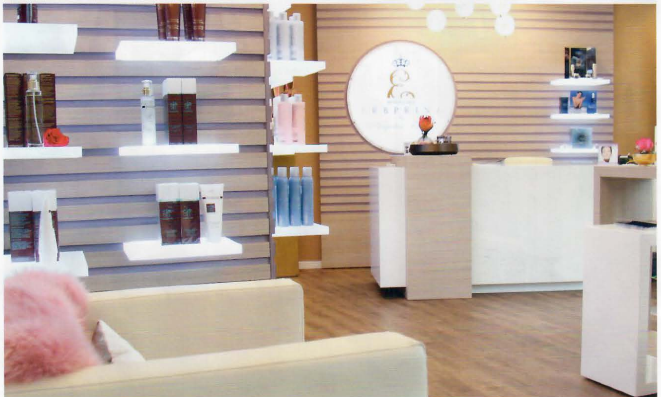
Die ausgewählten Produkte im „Kosmetikstudio & Beauty Spa“ des Hotels Erbprin in Ettlingen sind gut ausgeleuchtet und werden dem Kunden optimal präsentiert.