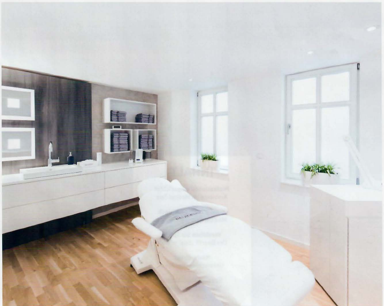
Die Farbgestaltung des Medical Spas „skinmedics Diana Schoenheid“ in Erfurt ist in modernen, puristischen Weiß- und Grautönen gehalten. Der Parkettboden und die Holzwand geben als Kontrast warme und natürliche Impulse.

MEDICAL SPA – Ein Ambiente in coolem Purismus oder natürlicher Behaglichkeit – moderne Medical Spas sind vielseitig. Für den Erfolg ist ein professionelles Gesamtkonzept maßgeblich. Worauf es zu achten gilt, erklärt Bernd Törkel.