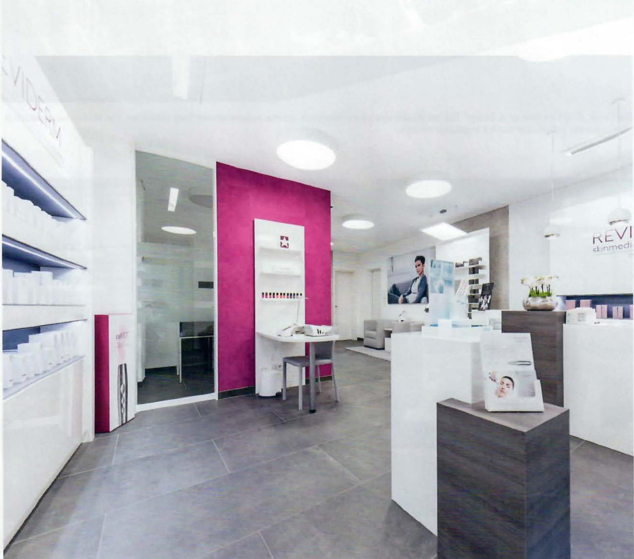
Der Empfangsraum des Medical Spas „skinmedics Diana Schoenheid“ hat eine offene und helle Architektur. Die Erlebniskette des Spas ist klar ersichtlich.

medizinisch eingerichteten Fachinstituten. Ziel der Einrichtung sollte eine für den Kunden architektonisch schlüssige Erlebniskette sein. Für ein erfolgreiches Medical Spa benötigt man darum konzeptionell, architektonisch und medizinisch erfahrene Partner. Die sorgfältige Vorselektion und klare Positionierung zum „Medical Spa“ ist eine große Erleichterung für die Besucher, da sie sich so bequem treiben lassen können und sich geführt fühlen. Stressige Entscheidungen werden bereits durch eine klare Präsentation ausgeschaltet , die darum besonders wichtig und erstrebenswert ist.